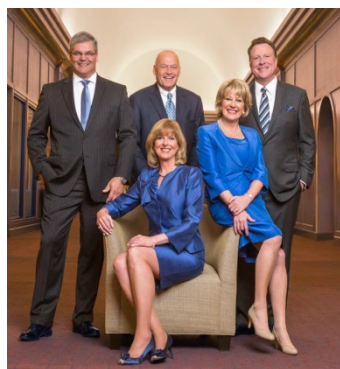
2014年度MDRT役員会メンバー